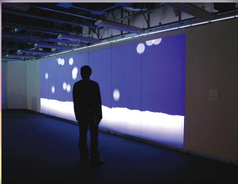
赤川智洋 / Below the Shank ©Tomohiro AKAGAWA