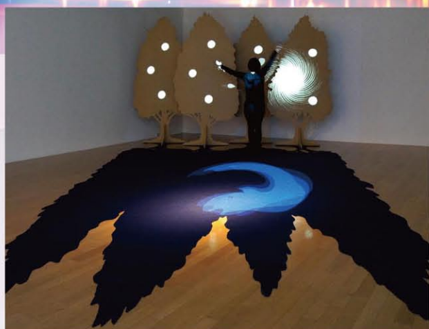
ブラブラックス (近森基 / 久納鏡子 / 寛康明 / 小原藍) / Glimmer Forest