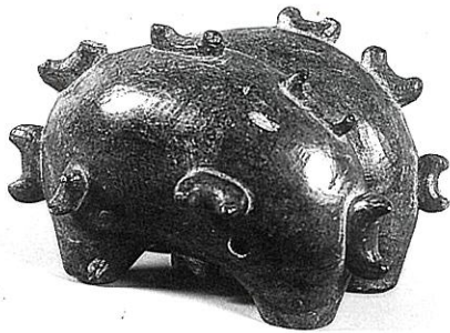
重要文化財 伝湯梨浜町出土(鳥取県) 子持勾玉 鳥取県立博物館蔵