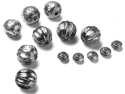
国宝 藤ノ木古墳(奈良県) 銀製鍍金空玉 文化庁蔵

本展は、全国各地から選りすぐった国宝・重要文化財を含む古墳時代の出土玉類を中心に構成します。いにしえの人々の美意識の結晶ともいえる玉を通して、古代日本の歴史・文化を広く紹介します。