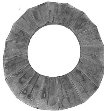
重要文化財 雨の宮1号墳(石川県) 緑色凝灰岩製腕輪 中能登町教育委員会蔵