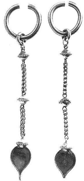
重要文化財 宮山古墳(兵庫県) 金製垂飾付耳飾 姫路市教育委員会蔵