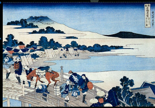
葛飾北斎 / 諸国名橋奇覧 ちぢんふくみの橋 天保4~5年(1833~34年)頃