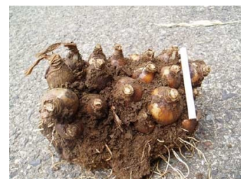
3年以上経つと球根が分かれて過密状態となります。