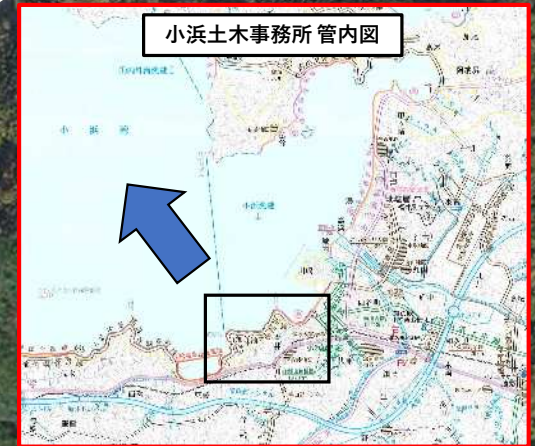
小浜土木事務所管内図