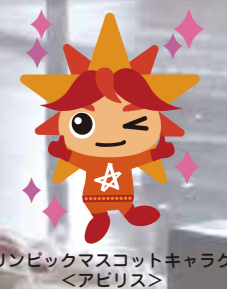
アビリンピックマスコットキャラクター <アビリス>