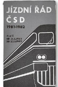
チェコスロバキア時刻表