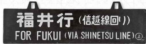
急行越前行先表示板