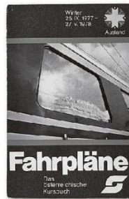
オーストリア時刻表