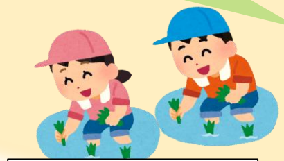
農村体験イベント