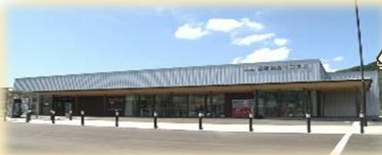
直売所(道の駅含む)