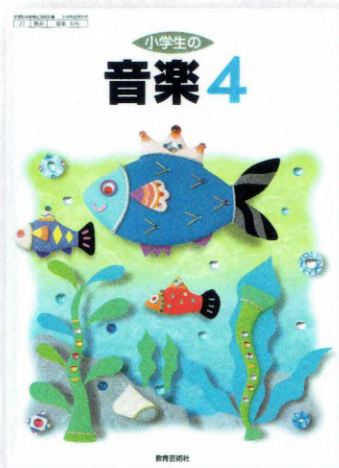
教育芸術社 『小学生の音楽4』(平成17年)