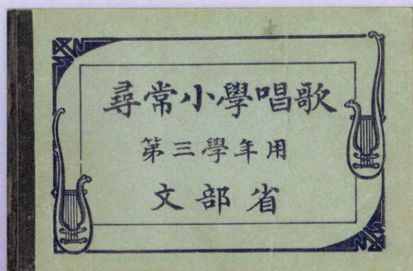
『尋常小学唱歌 第三学年用』(明治43年)