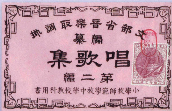
『小学唱歌集 第二編』(表紙裏 明治14年)