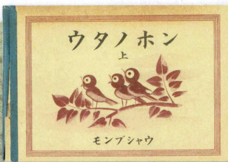
『ウタノホン 上』(昭和16年)