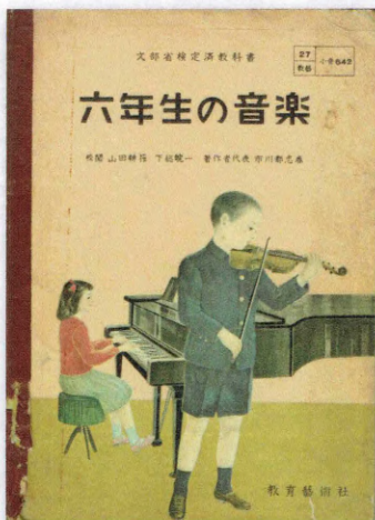
教育芸術社 『六年生の音楽』(昭和30年)