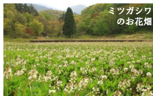
ミツガシワ のお花畑