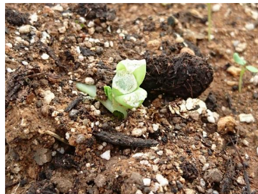
図3 ネキリムシ類被害株（キャベツ）