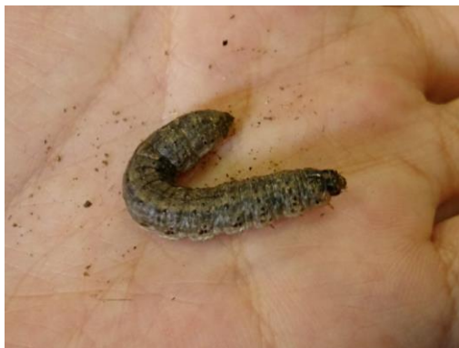
図2 カブラヤガ幼虫