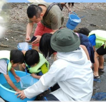
採集できた生きものを観察します。