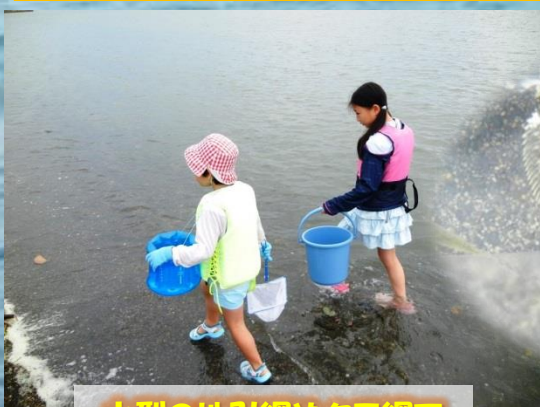
小型の地引網やタモ網で 生きものを採集します。

・同じ場所で7月29日、10月19日、1月26日にも開催します(4月2日から予約開始)。年間を通じて参加すると四季の変化を知ることができます。