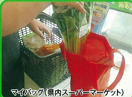
マイバッグ(県内スーパーマーケット)

1世帯1月当たりの食べ残し等の食費は、約2,400円、また、外食時の料理の約2割が食べ残しとなっています。家庭での適量調理や量り売り、ばら売りの利用等や外食時の適量注文等で食べ残しをしないよう心がけましょう。