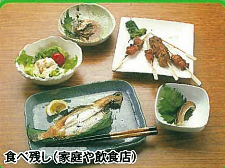
食べ残し(家庭や飲食店)