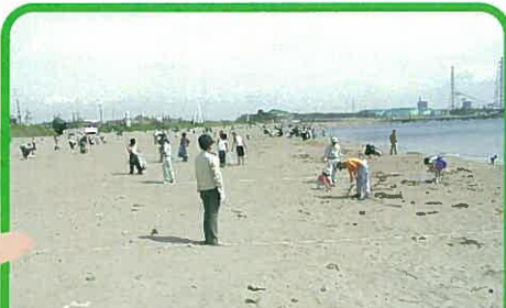
クリーンアップ活動(三国サンセットビーチ)

あなたにとって、不要になったものでも、使いたい人がいるかもしれません。使えるものはフリーマーケットやリサイクルショップを利用し、必要な人に譲って繰り返し使しましょう。