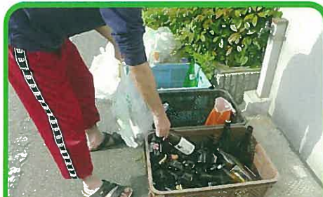
ごみの分別(福井市内ごみステーション)

ごみのポイ捨てをなくし、地域の環境美化を進めましょう。たとえば、海岸のごみも多くは、日常の生活でポイ捨てされたものが、川や水路を通して海へ流れ出したものです。道路も河川も、もちろん海もごみ箱ではありません。