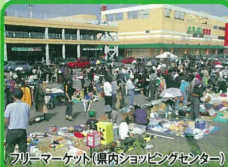
フリーマーケット(県内ショッピングセンター)

国内で1年間に使用されるレジ袋は約300億枚(1人1日約1枚)を超えていると言われており、その多くは1度使われた後、ごみとして処分されています。マイバッグを持って買い物に行き、レジ袋を受け取らないようにしましょう。