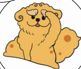
あさみゅー マスコットキャラ シシカゲ