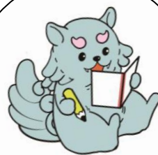
あさみゅー マスコットキャラ おコマ