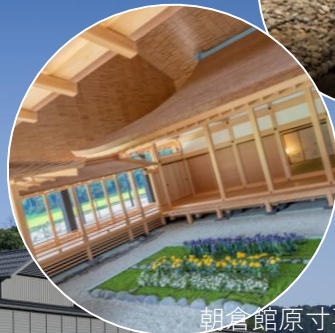
朝倉館原寸再現室