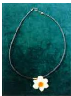
水仙チョーカー 1080円