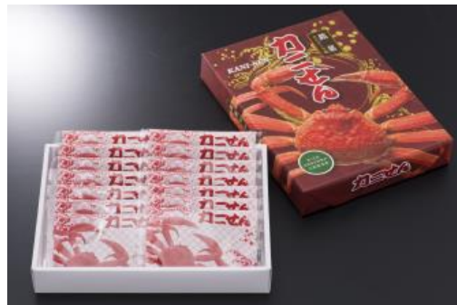
カニせん 14枚入 756円 20枚入 1080円