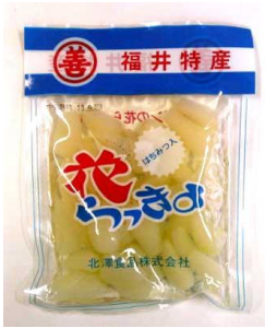
はつみつ入花らっきょ 80g 378円