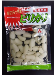
ピリカリらっきょ 403円