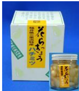
はちみつ入花らっきょ 120g 648円