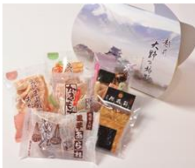
越前大野の旅路 6袋入 1026円