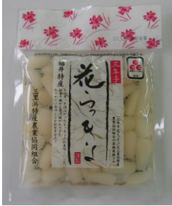
三年子花らっきょ 336円