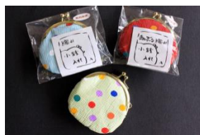
縮み小銭入れ(小)まあぶる 864円