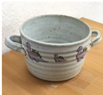
恐竜スープマグ 1296円