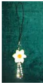
水仙バッグチャーム 1080円