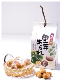
里芋あられ箱入 60g 648円