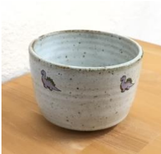
恐竜フリーカップ 864円