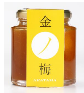
金の梅黄金煮ジャム 240g 1296円