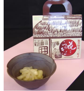
花らっきょ 手さげ箱 1045円