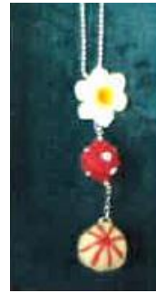
水仙バッグチャーム(フェルトボール付) 1296円