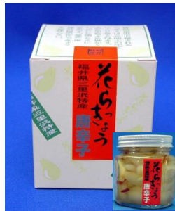
唐辛子入花らっきょ 120g 648円