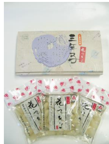
三年子花らっきょ ギフト 3入 1112円