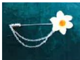
水仙ハットピン 1080円