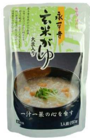
永平寺玄米がゆ 270円