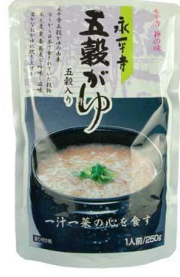
永平寺五穀がゆ 270円