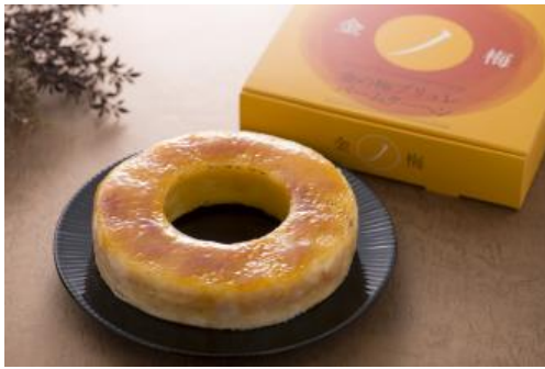
金の梅ブリュレバームクーヘン 1296円