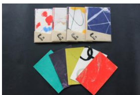
手すき気ままはがき(5枚入) 324円