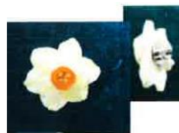
水仙タックピン 864円