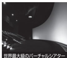
世界最大級のバーチャルシアター

バーチャル映像シアターや宇宙発電所アトラクションなどで「エネルギー」と地球の未来を考える体験型施設。