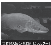
世界最大級の淡水魚「ヒラルクー」

熱帯雨林の温室「トロピカルワンダー」など体験しながら楽しく遊べるサイエンスパーク。