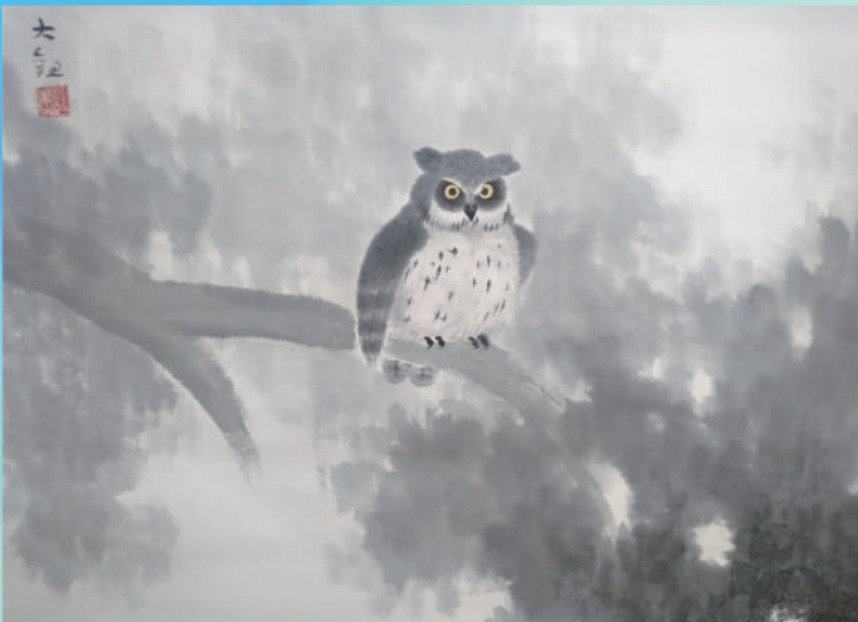
横山大観《木菟》（部分）滋賀県立近代美術館（延長期）