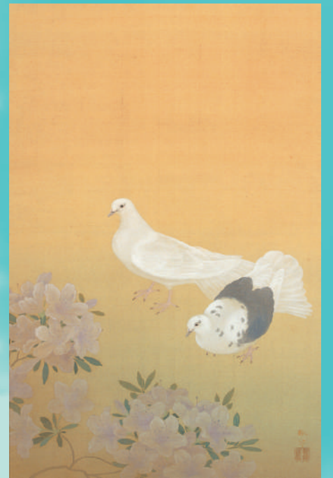
菱田春草《温麗 躑躅双鳩》（部分） 福井県立美術館（延長期）