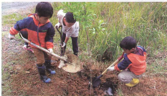
子ども達の森林学習(若狭町)