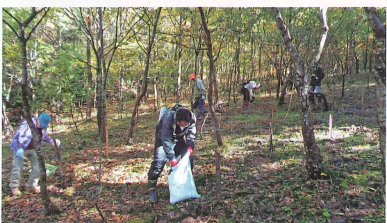
ボランティアによる森づくり活動(永平寺町)