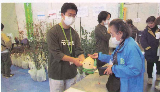
緑化苗木の配布(敦賀市)