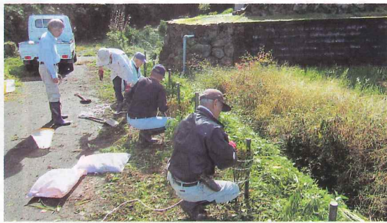
地域での植樹活動(南越前町)