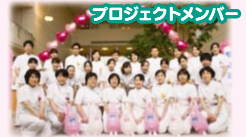
プロジェクトメンバー