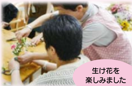
生け花を 楽しみました