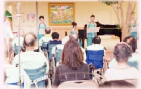
歌やダンスをみんなで一緒に

5月12日は看護の創設者であるナイチンゲール女史の生誕日です。この日を記念して、平成3年に「看護の日」が制定されました。看護部では、今年5月15日に「広げよう思いやりの『わ』癒そうあなたの心と身体」をテーマに看護週間行事を開催しました。