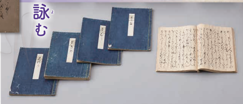
源氏物語〔大島本〕〈重文〉