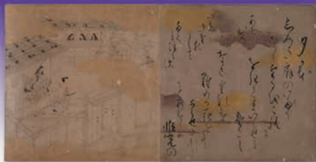
源氏物語淡彩白描画 (国文学研究資料館蔵)