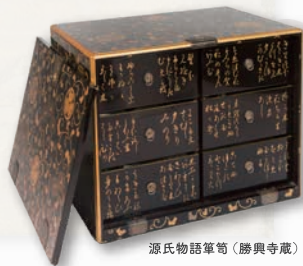
源氏物語筆箱 (勝興寺蔵)