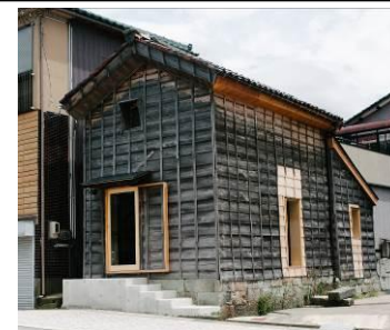
③ 飲食店などショップに改修 [H26～]