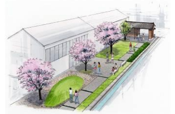
④ 湊座奥の倉庫 → 映像上映・展示・交流スペース [H27]