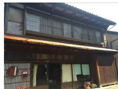
⑤ 公募物件 [H27]