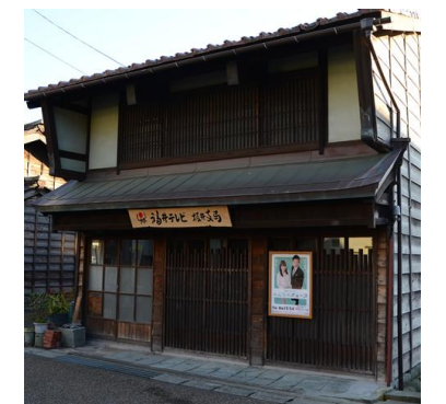
⑥ 公募物件 [H27]