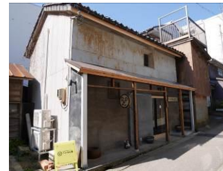
① 工房・ショップ等に改修 [H26]