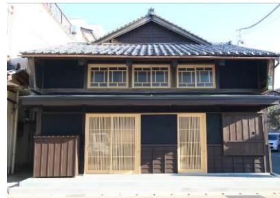
② 古民家ゲストハウスに改修 [H26～H27]