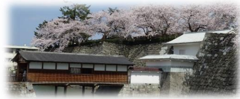
歴史を学ぼう 山里口御門