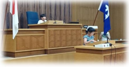
本会議場で議会体験