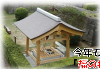
今年もやります♪ 「福の井」で水くみ体験!

※天候や業務の都合等により見学か所や内容等が予告なく変更になる場合がございます。