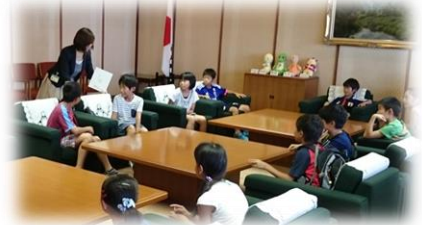
応接室で知事気分

ちじ おうせつしつ きひんしつ きかいぎじどう そうごうほうさい 今春完成 やまざとぐちこもん ふく い けんけいさつほんぶ ～知事応接室、貴賓室、議会議事堂、総合防災センター、山里口御門、福の井、県警察本部～