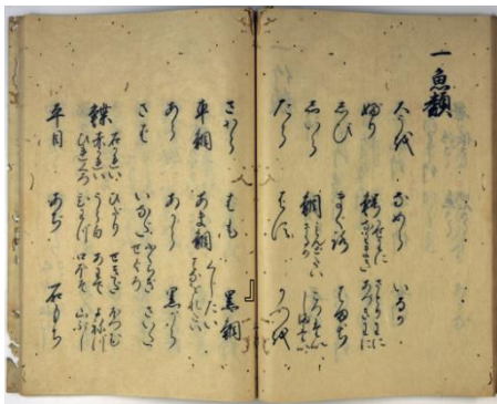
越前国福井領産物