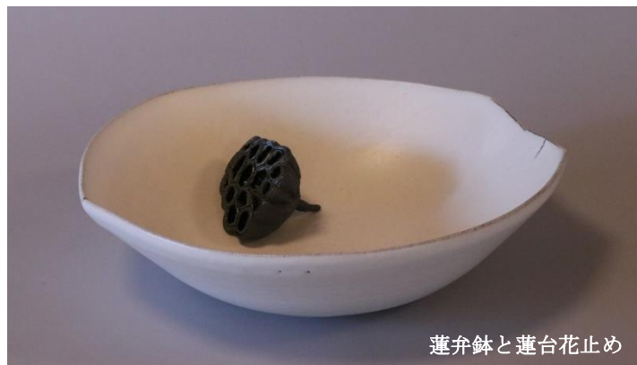
蓮弁鉢と蓮台花止め