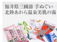
福井県三國湊 手ぬぐい 北陸あわら温泉美肌の湯