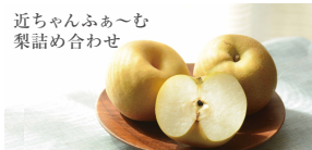
近ちゃんふあ〜む 梨詰め合わせ

8月28日(日)抽選会までに上記の対象スポットで 農遊コンシェルジュカードを1枚以上ゲットし、ご 持参ください。※各施設への入場料は無料です。 農遊コンシェルジュカードをご持参いただいた方 から、当日抽選で地元の素敵なお土産をプレゼント させていただきます。