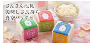
さんさん池見 美味しさ長持ち 真空パック米