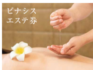
ピナシス エステ券