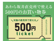
あわら坂井直売所で使える 500円のお買い物券