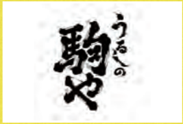
うすくちうるし 170ml用 外黒染 うるしの駒や