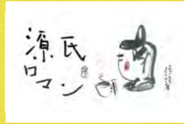
源氏物語ブレンド 自家焙煎 MAMI CAFE たちばな屋