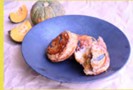
パンプキンミートパイ フィールドワークス&KIBO