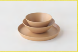
RIN&CO. 有賀薫コラボ 漆琳堂