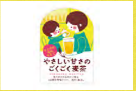
やさしい甘さのごくごく麦茶 大麦倶楽部