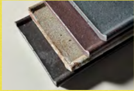
越前瓦器 越前セラミカ