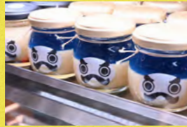
だるまぶりん 新幹線かがやき いのうえ