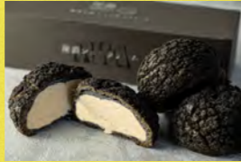
崖淵シュークリーム(抹茶味) 福日和