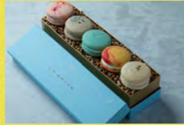
ふくいのマカロンアソート L'aisance