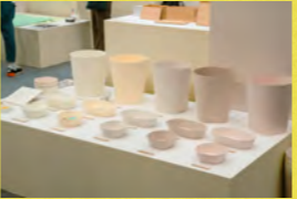
Food Paper 五十嵐製紙