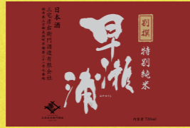
早瀬浦 別撰 特別純米 三宅彦右衛門酒造(有)