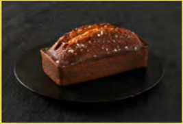
塩ミルクケーキ Apéro & Pâtisserie acoya