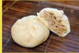
ジャパニーズ照り焼き肉まん まるこめ