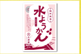
水ようかん 大津屋