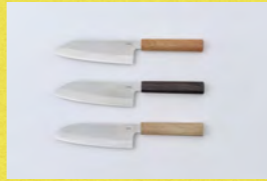
刃 (HATSU) Sharpening four