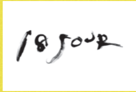
18SOUR 若狭三方ビレッジ(株)