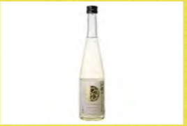
和櫻 3種 伊藤酒造(資)