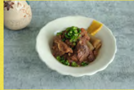
特選 若狭牛 牛すじ煮 牛若丸精肉店