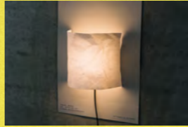
POSTER LIGHT サカエマーク