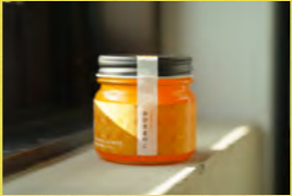
おひさまのこ アーバンキッチン