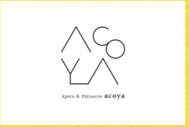
パウンドケーキ Apéro & Pâtisserie acoya