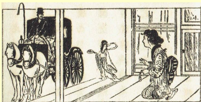
おしん物語（シンデレラ） 『国語読本 高等科女子用 巻一』（富山房 複製）