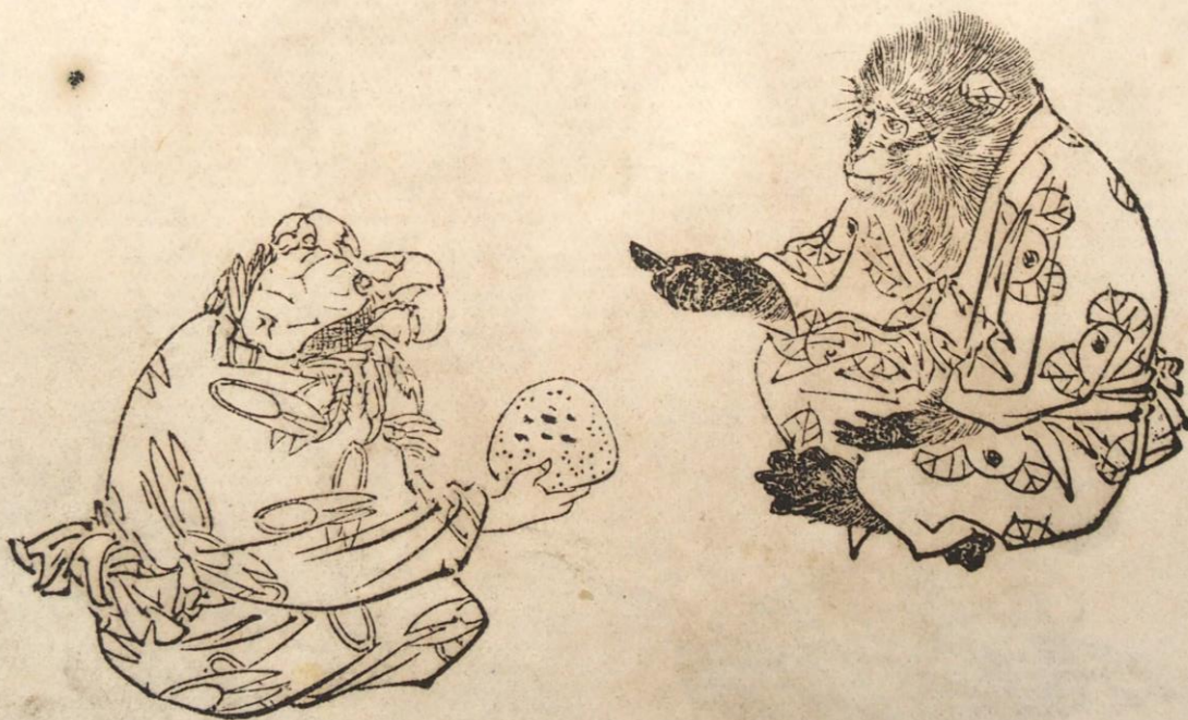
『尋常国語読本 甲種巻一』(金港堂)