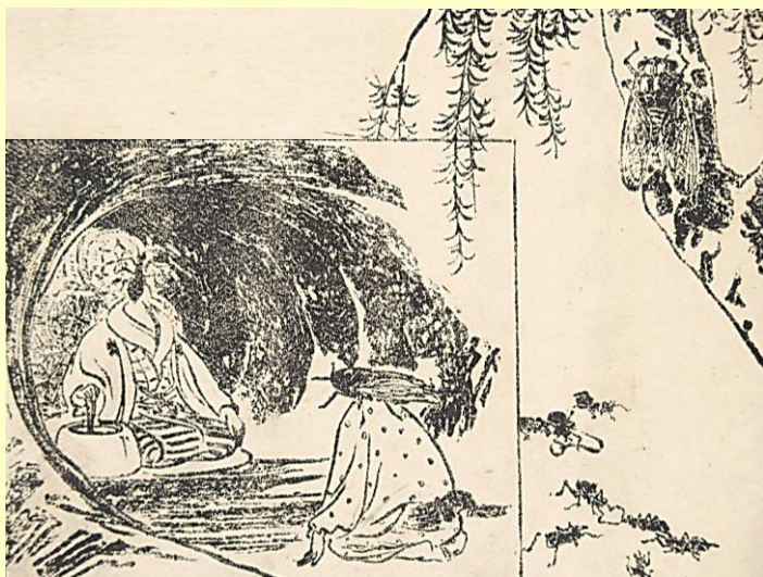
蟻トセミ（アリとキリギリス） 『国語読本 尋常小学校用 巻四』（富山房）