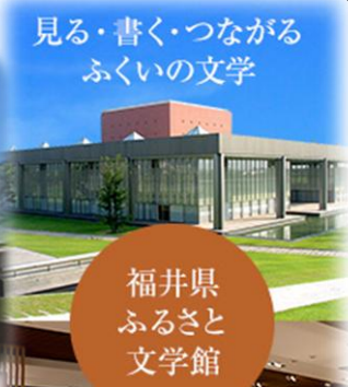
福井県 ふるさと 文学館