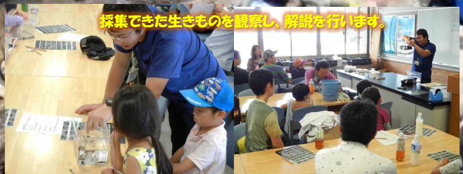
採集できた生きものを観察し、解説を行います。