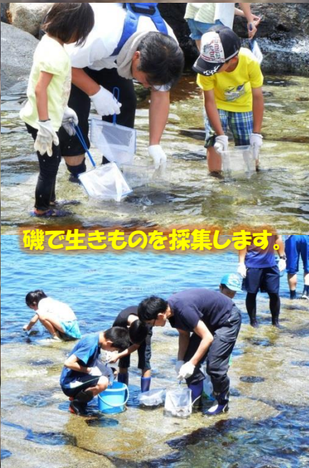
磯で生きものを採集します。