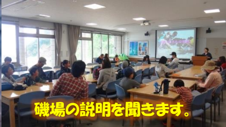
磯場の説明を聞きます。