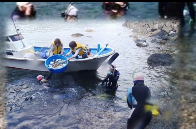
回収したゴミを船に引き上げます