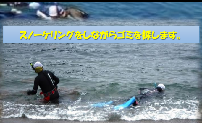
スノーケリングをしながらゴミを探します。