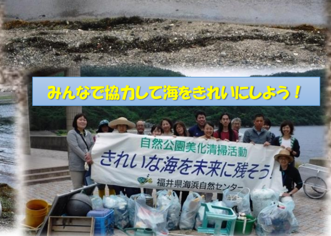
みんなで協力して海をきれいにしよう！