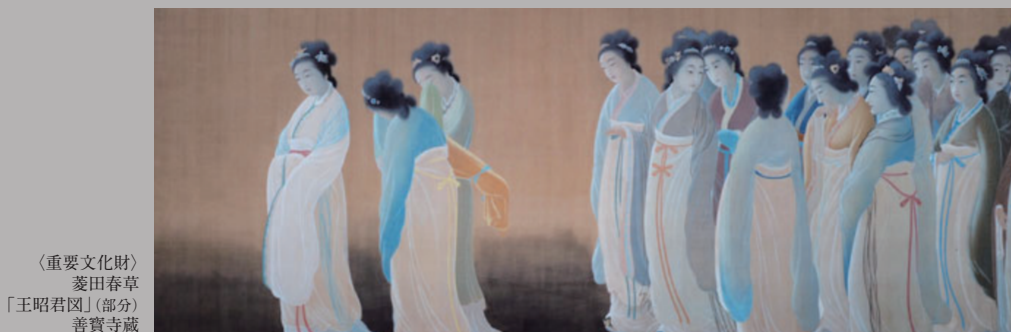
(重要文化財) 菱田春草 「王昭君図」(部分) 善寶寺蔵