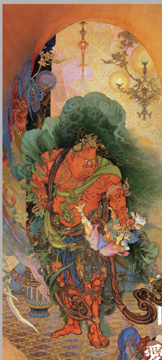
狩野芳崖 「仁王捉鬼図」(部分) 東京国立近代美術館蔵