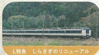
L特急 しらさぎのリニューアル

湖西線開業により「雷鳥」が米原駅を經由しな くなる事に伴い、1975年に米原発着として運行を 開始。2003年以降は列車名が「しらさぎ」に統合。