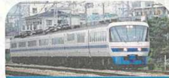
特急 スーパー雷鳥

1964年10月1日、大阪駅-富山駅間を運転開始。 2003年まで定期運行された。