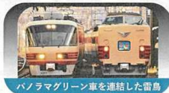
パノラマグリーン車を連結した雷鳥

1992年12月臨時「雷鳥」として681系試作編成 が運行開始。宣伝物等では「ニュー雷鳥」などと 宣伝された。