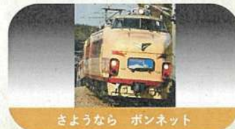
さようなら ポンネット

2015年「はくたか」「サンダーバード」で運用さ れた681系、683系への置き換えが行われ、現在 の姿で運転されている。