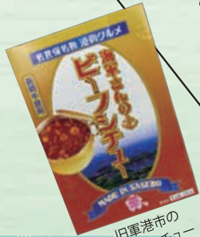
旧軍港市の ビーフソース