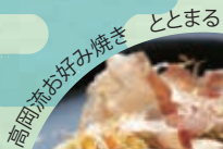
高岡流お好み焼き ととまる