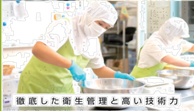
徹底した衛生管理と高い技術力

現在、県内の一般企業では約5,000人以上の障がいのある方が勤務しています。また、県内に約160ある障がい者の就労支援事業所において、約3,000人の方が働かれており、そこで食品加工・販売、農業、軽作業、データ入力などの事務作業、印刷、清掃など受託可能な業務も拡大しています。障がいのある方の雇用や働く場は広がっており、健常者と障がい者が共に活躍し、社会を支えていく共生社会に向け、ぜひ、新たなビジネスパートナーと出会いに来てください。