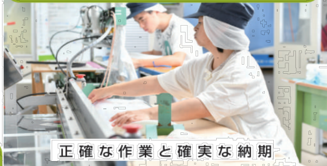
正確な作業と確実な納期