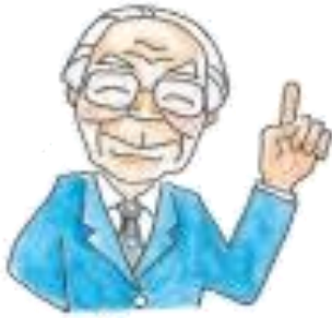
白川静(しらかわ・しずか)はかせ