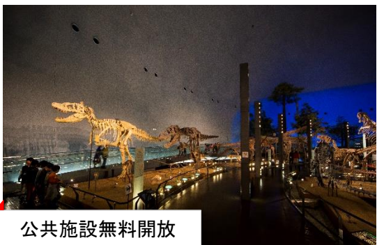
公共施設無料開放

日時：令和2年2月7日（金） 12:30～（要事前申込） 場所：福井県生活学習館 多目的ホール