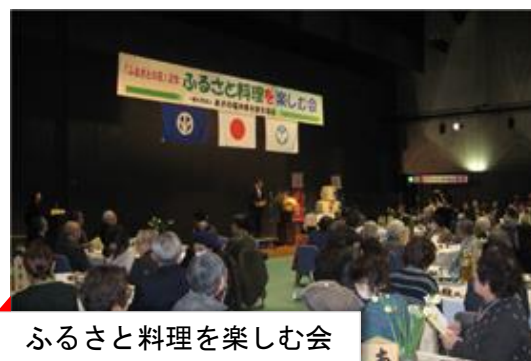
ふるさと料理を楽しむ会

県産品で作った「ふるさと料理」を楽しみ、全国に誇れる福井の食を県内外に発信します。 (主催：(一社)あずの福井県を創る協会)