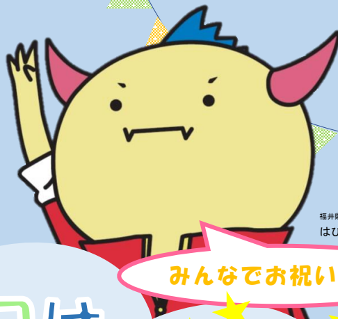
福井県マスコットキャラクター はびりゅう