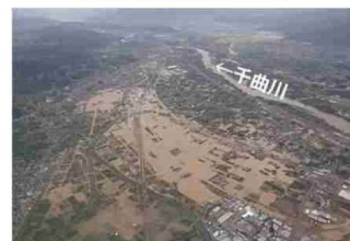
⑩千曲川における浸水被害状況 (長野県長野市)