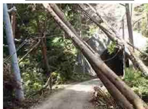
⑨電柱・倒木倒壊の状況 (千葉県鴨川市)