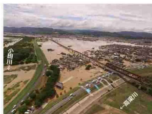
⑤小田川における浸水被害 (岡山県倉敷市)