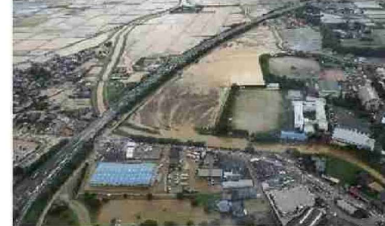
④桂川における浸水被害 (福岡県朝倉市)