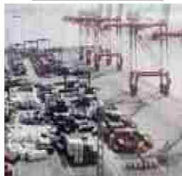
⑥神戸港六甲アイランドにおける浸水被害 (兵庫県神戸市)