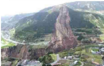
②土砂災害の状況 (熊本県南阿蘇村)