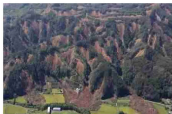
⑦土砂災害の状況 (北海道勇払郡厚真町)