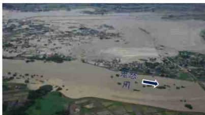
①鬼怒川の堤防決壊による浸水被害 (茨城県常総市)