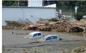
③小本川の氾濫による浸水被害 (岩手県岩泉町)