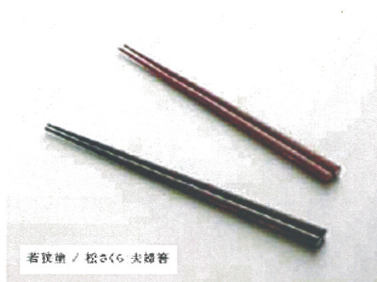
若狭塗 / 松さくら 夫婦箸