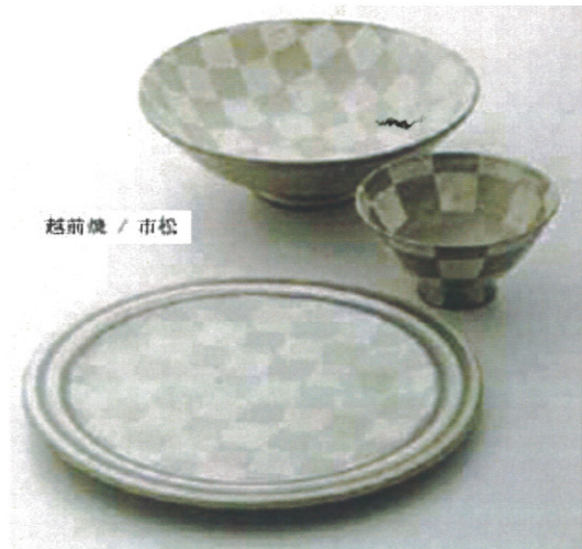
越前焼 / 市松