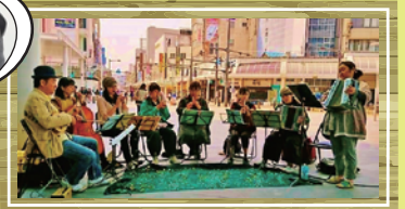
アイリッシュ音楽合奏 バーナ・ファールチェ