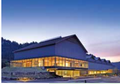
一乗谷朝倉氏遺跡博物館

2022年10月1日、中世都市遺跡「一乗谷朝倉氏遺跡」の全体像や歴史的価値を楽しみながら学べる博物館が開館。戦国大名朝倉氏の当主が暮らした館の一部を原寸で再現、遺構の露出展示、城下の町並みを再現した巨大ジオラマなどが見どころ。