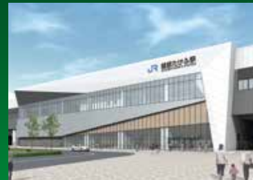
えちぜん 越前たけふ駅