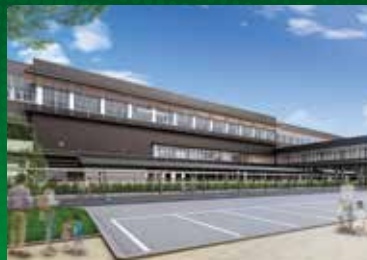
あわらおんせん 芦原温泉駅