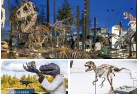
恐竜博物館【2023年7月14日リニューアルオープン】

福井県勝山市は恐竜化石の一大産地。その化石を収蔵する恐竜博物館は恐竜全身骨格をはじめ、化石やジオラマ、大迫力の復元模型などが数多く展示。世界三大恐竜博物館の1つとも言われ、大人から子供まで楽しめる。〈リニューアルの準備のため臨時休館中〉