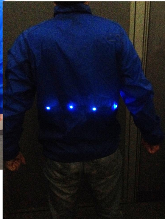
試作したLEDスポーツウェア写真