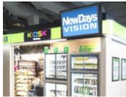
NewDays KIOSK 店頭ビジョン(イメージ)