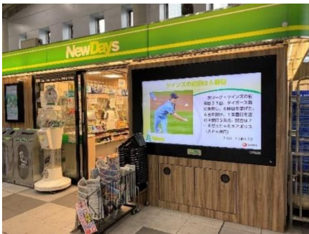
NewDays ビジョン(イメージ)