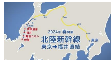
3. 北陸新幹線路線図