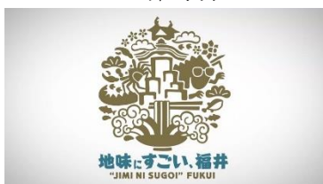
4. 「地味にすごい、福井」ロゴ