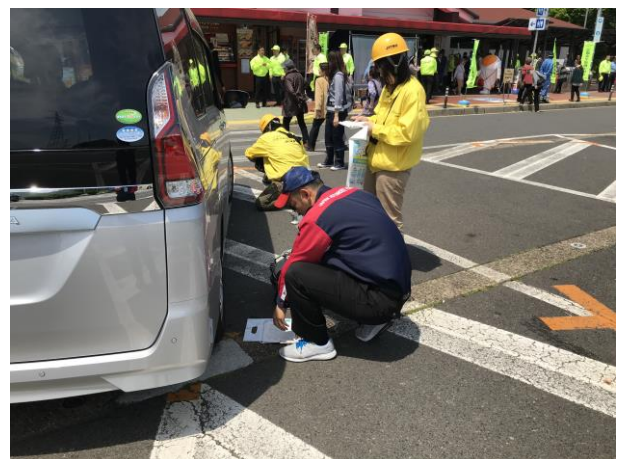
令和元年5月10日 南条サービスエリアにて