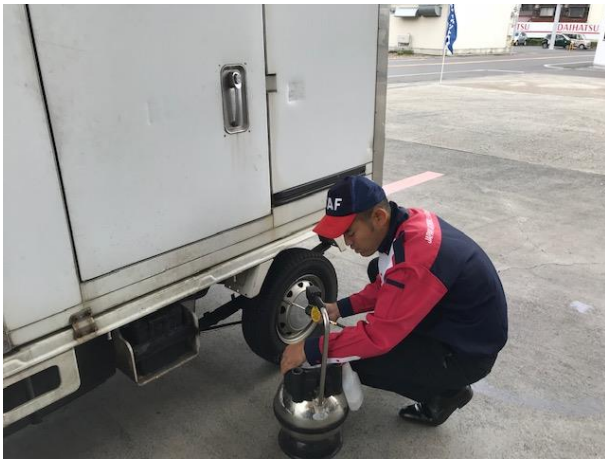
平成30年10月27日 敦賀市内にて