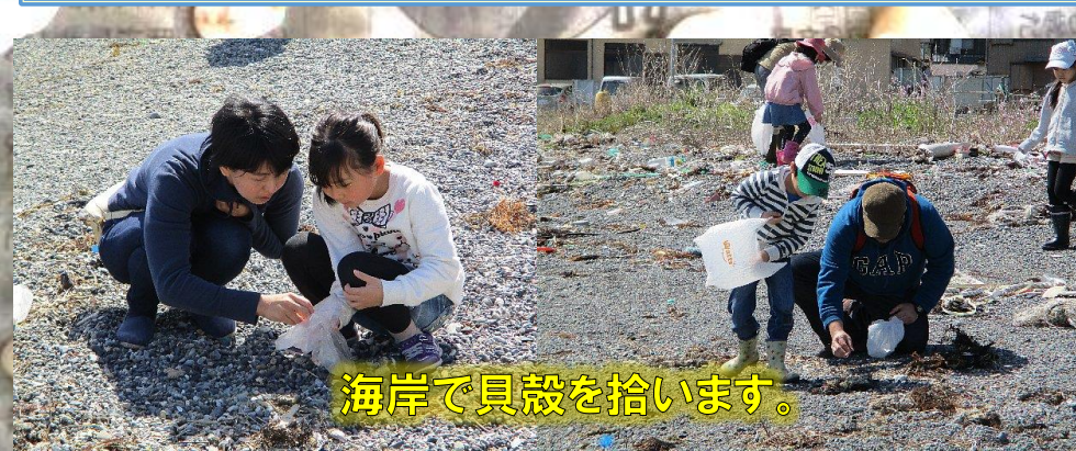
海岸で貝殻を拾います。