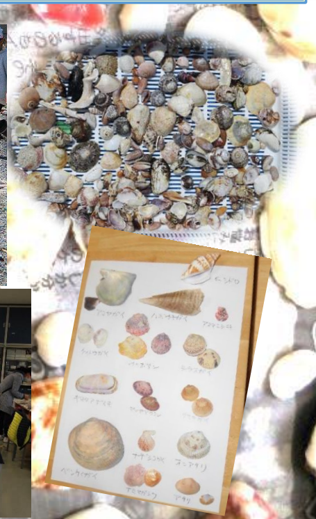
拾った貝殻の名前を調べて標本を作ります。