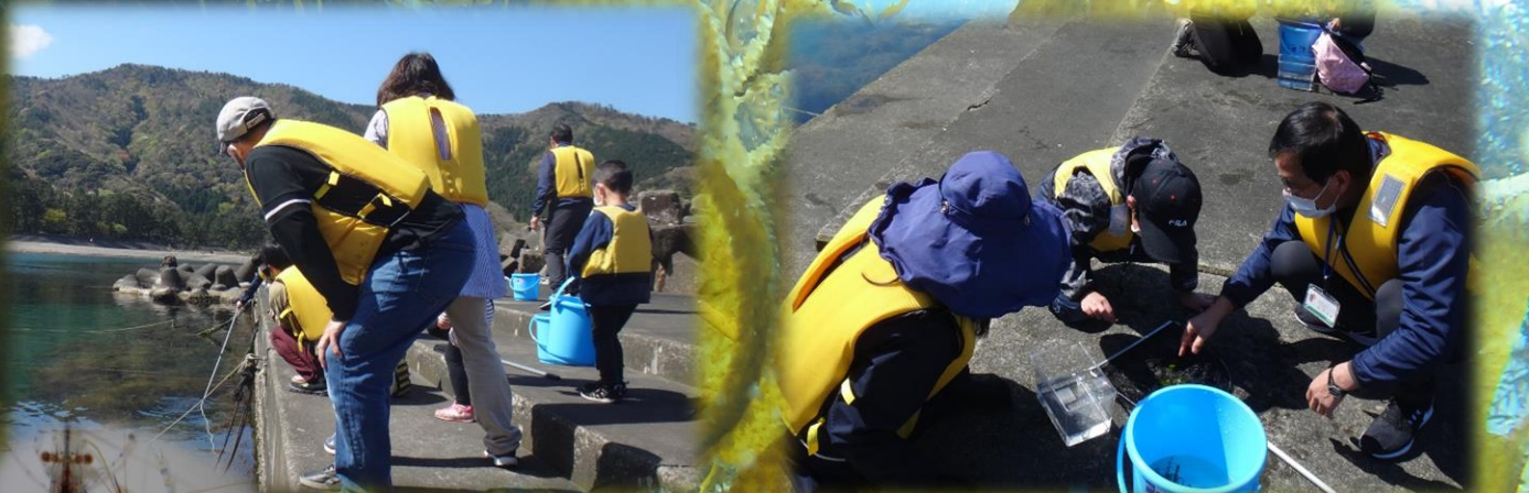
タモ網を使って海藻の中の生きものをすくいます。