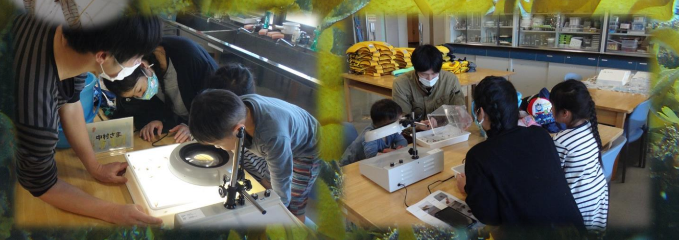
採集できた生きものを観察します。