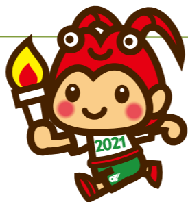
2021三重とこわか国体・三重とこわか大会 マスコットキャラクター とこまる

三重県子ども・福祉部子育て支援課 内 平成30年度 健やか親子21全国大会実行委員会事務局 住所 〒514-8570 三重県津市広明町13番地 電話 059-224-2248 F A X 059-224-2270