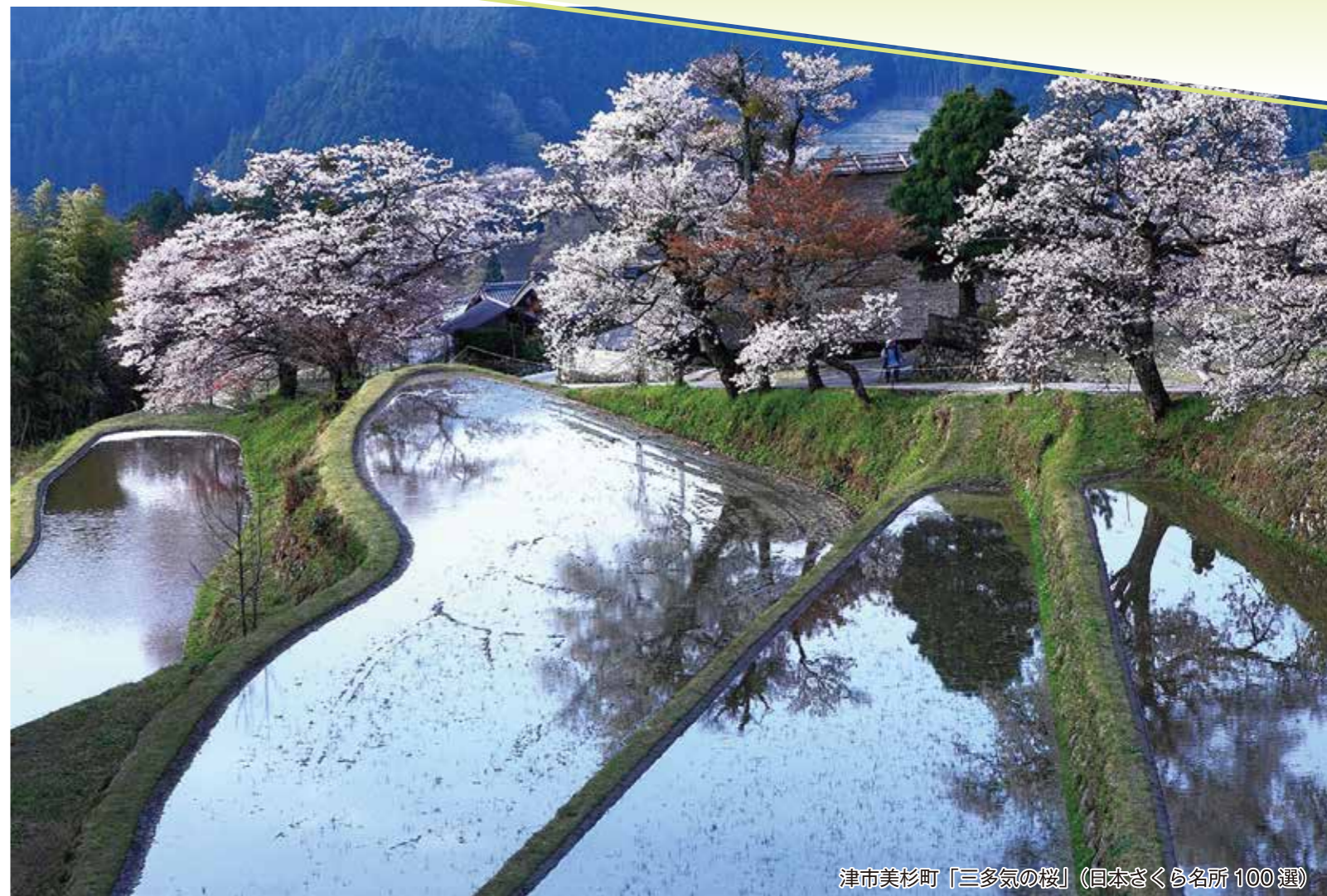
津市美杉町「三多気の桜」(日本さくら名所100選)