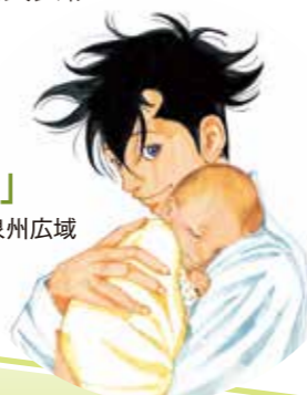
「コウノドリ」©鈴木ユウノ 講談社