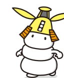
津市PRキャラクター シロモチくん