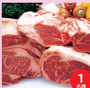
若狭牛 すき焼き肉500g (2~3人前)