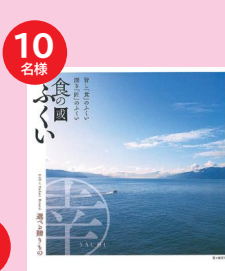
食の国ふくい「カタログギフト」