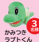
かみつきラプトルくん