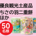
優良観光土産 ちさの羽二重餅ほか