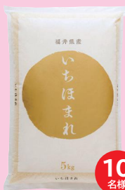
いちほまれ 5kg (5kg×1袋)