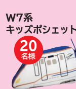
W7系 キッズポシェット