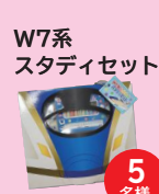
W7系 スタディセット