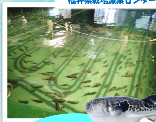
福井県栽培漁業センター