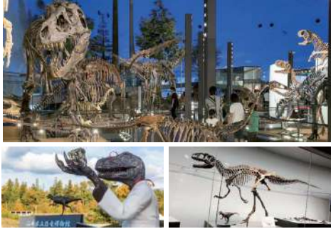
恐竜博物館【2023年夏リニューアルオープン!】

福井県勝山市は恐竜化石の一大産地。その化石を収蔵する恐竜博物館は恐竜全身骨格をはじめ、化石やジオラマ、大迫力の復元模型などが数多く展示。世界三大恐竜博物館の1つとも言われ、大人から子供まで楽しめる。(リニューアルの準備のため臨時休館中)