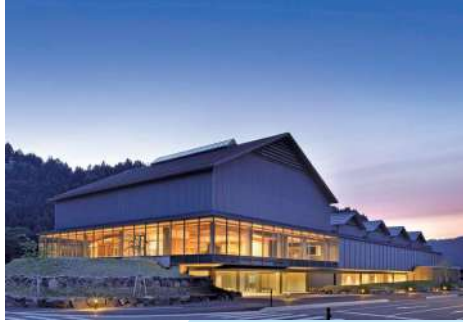
一乗谷朝倉氏遺跡博物館

2022年10月1日、中世都市遺跡「一乗谷朝倉氏遺跡」の全体像や歴史的価値を楽しみながら学べる博物館が開館。戦国大名朝倉氏の当主が暮らした館の一部を原寸で再現、遺構の露出展示、城下の町並みを再現した巨大ジオラマなどが見どころ。