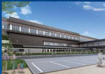
あわらおんせん 芦原温泉駅