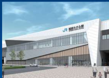
えちぜん 越前たけふ駅