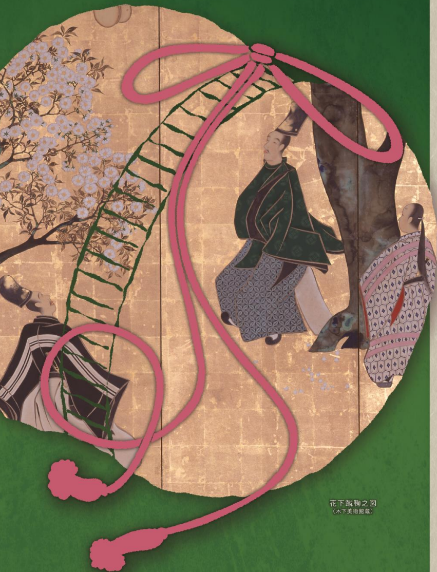
花下蹴鞠之図 (木下美術館蔵)