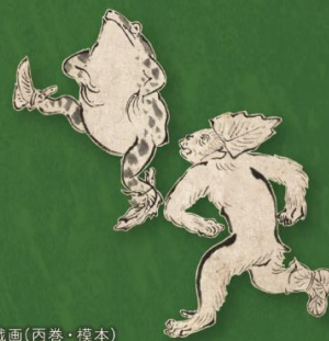
鳥獣人物戯画(丙巻・模本) (京都市立芸術大学芸術資料館蔵)