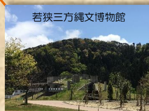
若狭三方縞文博物館