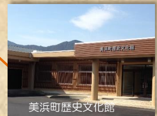
美浜町歴史文化館