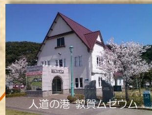
人道の港 敦賀ムゼウム