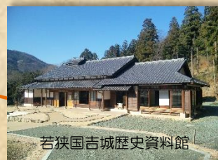
若狭国吉城歴史資料館