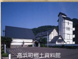
高浜町郷土資料館