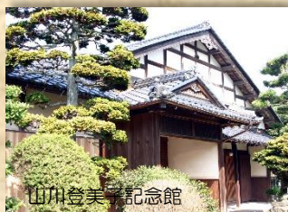
山川登美子記念館

福井県立若狭図書館学習センターは、今年開館 30 周年を迎えました。これを記念して、類縁施設である嶺南地域のおもな博物館・資料館等を紹介。また同会場で、若狭路の学芸員が選んだ「私の 1 冊」も紹介します。