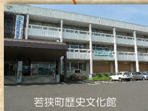
若狭町歴史文化館