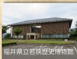
福井県立若狭歴史博物館