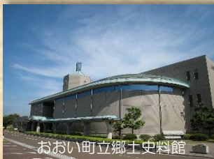
おおい町立郷土史料館