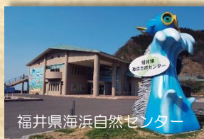
福井県海浜自然センター