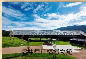
福井県年縞博物館