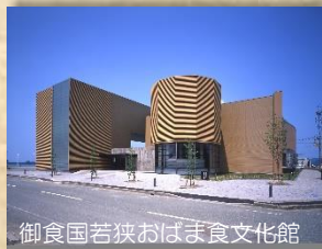
御食国若狭おばま食文化館